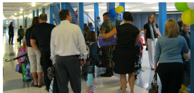
Des parents accompagnent leur(s) enfant(s) lors de la première journée d'école. Deux semaines après la rentrée ont eu lieu des sessions d'information.

se de leur enfant et d'établir un contact direct entre les parents et le personnel de l'école. Comme d'habitude, ces soirées ont été bien fréquentées cette année. Le personnel de l'école tient donc à remercier les parents pour l'intérêt qu'ils témoignent envers l'éducation de leur(s) enfant(s)!