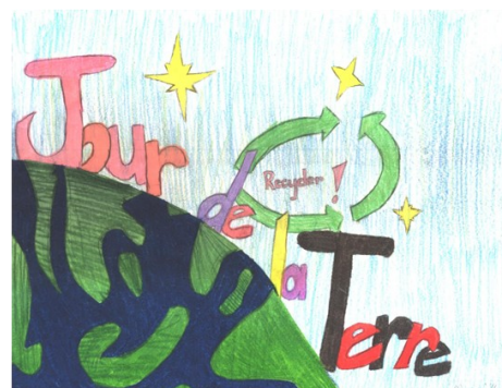
Logo du Jour de la Terre 2011 par Michaëlla Bruneau

Nous espérons que vous avez aimé ce premier numéro du journal mensuel d'information de l'école Anna-Malenfant. C'est un nouveau projet auquel pourraient venir s'ajouter des nouvelles chroniques dans les numéros à venir. Nous apprécierions entendre vos commentaires et vos suggestions afin d'améliorer notre journal d'information. Merci et bonne année scolaire!